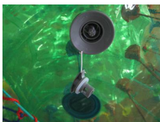
2. 将盖子沿逆时针方向旋出