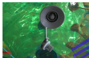
3. 将中间小旋钮向下按并沿顺时针拧松