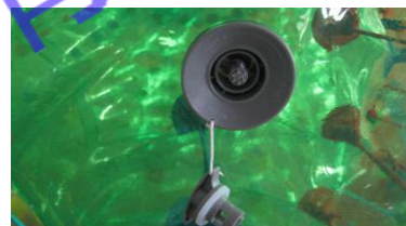
6. 气压不足，需补气时，旋出盖子将中间小旋钮向下按并沿顺时针拧松