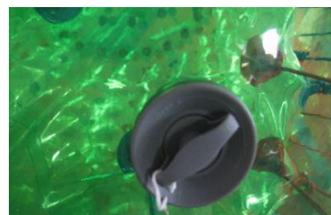
9. 在发现气嘴边缘漏气时，用维修握把套入气嘴的槽内然后顺时针锁紧，最后旋紧盖子