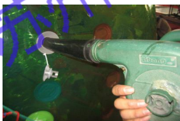
7. 将气泵对准进气口补气，补气完毕，将中间小旋钮沿逆时针拧紧（弹出）并将外盖盖好